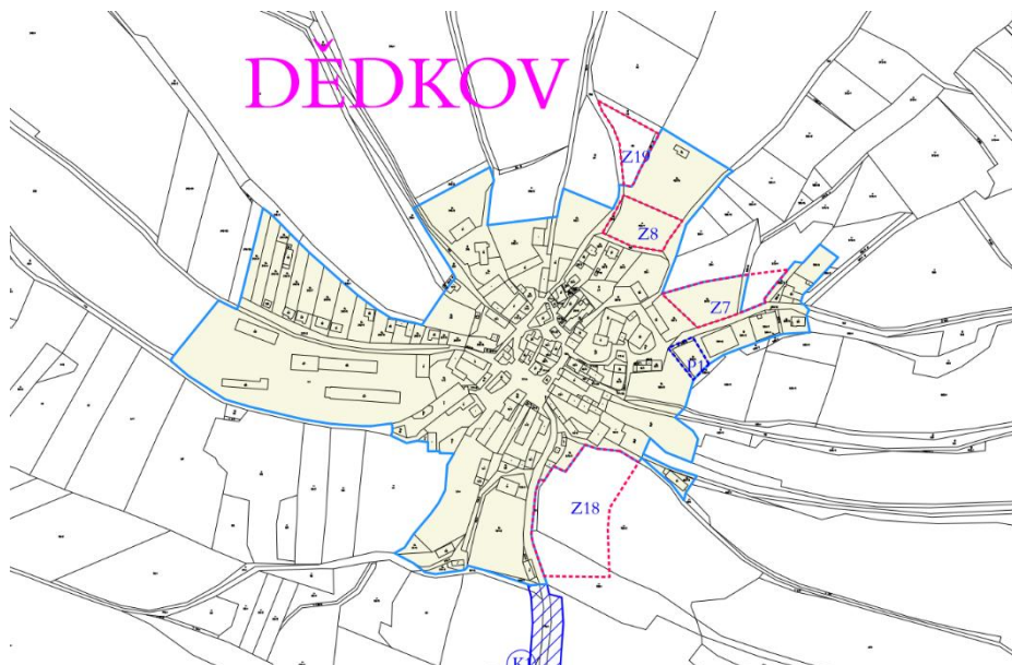
Obrázek 2: Výřez z výkresu základního členění ÚP místní část Dědkov.