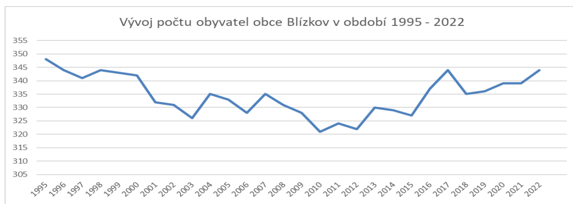
Obrázek 3: Graf vývoje počtu obyvatel v obci Blížkov, data jsou vždy k 31. 12. 2022 (Zdroj: Český statistický úřad; http://vdb.czso.cz/ ).

Rozvoj obce s ohledem na vývoj počtu obyvatel je znázorněn grafem (viz. Obr. 1). Počet obyvatel v obci Blížkov měl do roku 2003 klesající charakter. Od té doby se počet obyvatel pohyboval okolo 330 obyvatel, v posledních letech je patrná vzrůstající tendence počtu obyvatel.