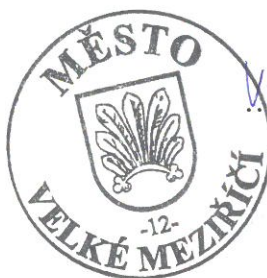
starosta města Velké Meziříčí